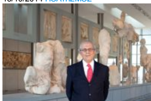
«Ο Έλληνας ξέρει να βρίσκει λύσεις εκεί που υπάρχουν αδιέξοδα» της Μαρίας Θεμισσί